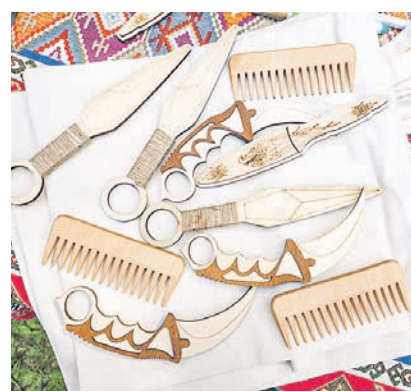
... и аутентичные орнаменты на деревянных гребешках для волос