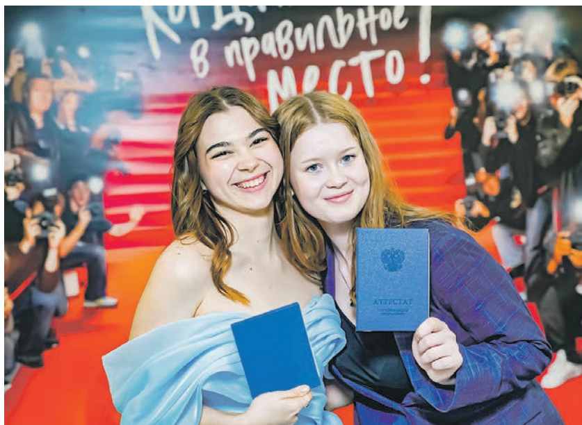
Медиацентр школы № 338

спецэффекты, поздравления от известных артистов, иммерсивное шоу,