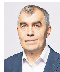
Фото управы района Коммунарка