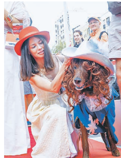
Пёс в костюме Д'Артаньяна покорила сердца зрителей

Здесь и в обычный день среди скульптурных фигурок троллей чувствуешь себя одним из героев финской писательницы, а 5 июля главная площадь ЖК «Скандинавия», казалось, превратилась в островок сказки, где каждый мог стать немного волшебником, примерить любой образ и освоить навык, который, возможно, пригодится в будущем: научиться петь или рисовать, вылепить из глины горшочек или узнать, как дети создают удивительные фонарики, смоделировать на 3D-принтере конструкцию, посадить цветы в огороде, сыграть партию-другую в шашки и другие настольные игры, поучаствовать в спортивной эстафете, а то и просто попробовать различные вкусы в представленной лавке гастрономии.