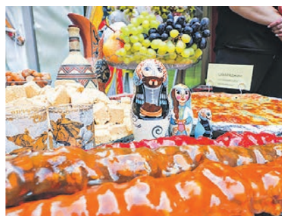
Традиционные осетинские сладости...

На сцене парка плясали национальные танцы, звучала музыка и исполнялись народные песни. Но главным событием стала выставка народного искусства, на которой посетителям показали традиционные костюмы, предметы быта и украшения народов России. Её подготовили ребята из молодёжных па-