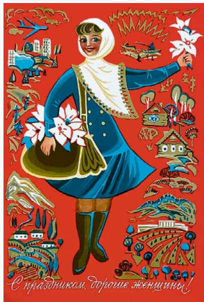
Электронная копия открытки из архива Дарьи Соколовой

В отличие от дореволюционной России, женщина уже не прячется за спиной мужа, не стоит на кухне возле корыта, а созидает новый