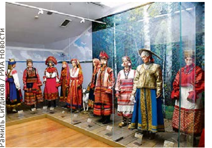
Раммель Сидликов / РИА Новости

Здесь можно увидеть экспозицию, посвященную отечественному культурному наследию, традициям и жизни русского общества до Октябрьской революции 1917 года. В музее отражены художественный