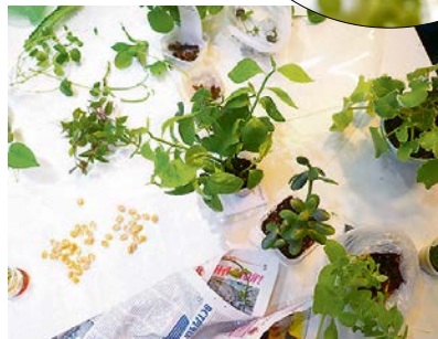
Тыквенные семечки – как раз на рассаду к дачному сезону

для дочери Марии. Заказ был конкретный: добыть новые кактусы.