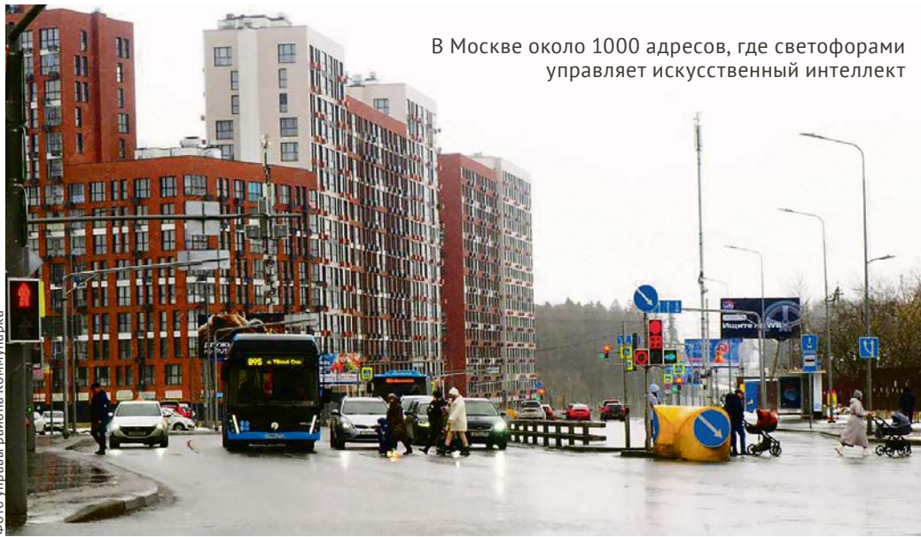
В Москве около 1000 адресов, где светофорами управляет искусственный интеллект

Вдоль улицы Александры Монаховой по программе «Умные перекрёстки» устанавливают новые светофоры и пешеходные переходы. Рабочие перекалывают асфальт, проводят кабели, благоустраивают прилегающую к светофорам пешеходную зону, размечают зебру.