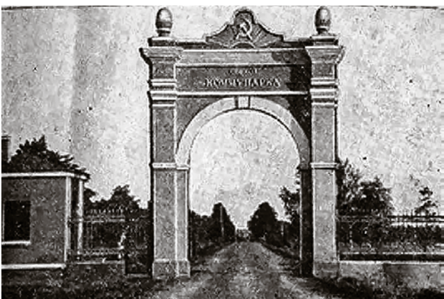
Фото префектуры ТИНАО