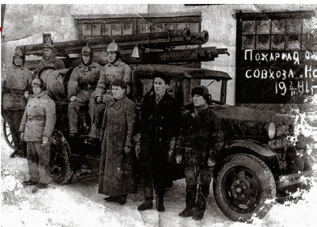
Работники построенной в 1941 году пожарной части боролись с последствиями бомбёжек

Защищать страну на фронты Великой Отечественной ушли 138 жителей деревни Саларьево