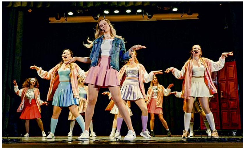
Фото театра-студии «Метод Немировича»