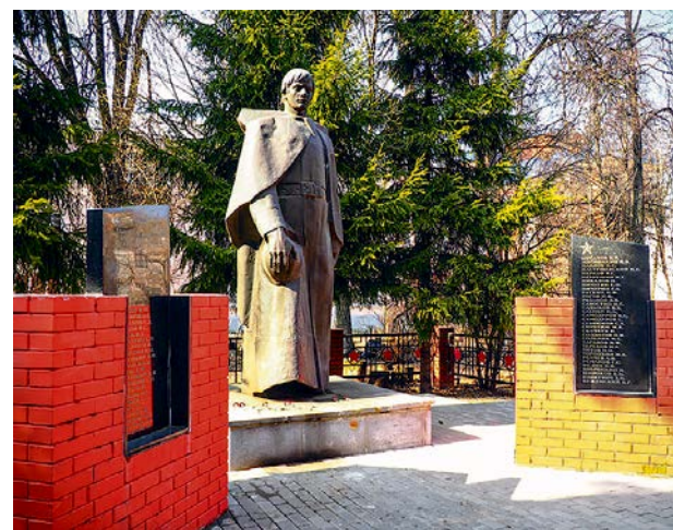
С двух сторон от фигуры бронзового солдата расположены памятные доски с именами местных жителей, погибших в годы Великой Отечественной

В центре композиции – аллегоричная фигура солдата высотой три метра из бронзового листа. С двух сторон расположены памятные доски с именами местных жителей. А в 2018 году слева и справа от памятника установили две гаубицы, подаренные Министерством обороны РФ.