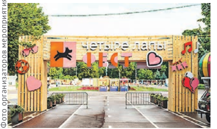
Фото организаторов мероприятия

В Измайловском парке всех любителей животных ждут два дня лекций, игр, шоу, музыки и добрых дел на свежем воздухе. Программа вклю-