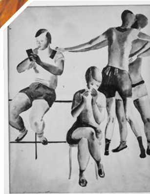
А. А. Дейнека, «Физкультура наоборот»