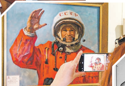
А. И. Плотнов, «Юрий Гагарин перед полётом»