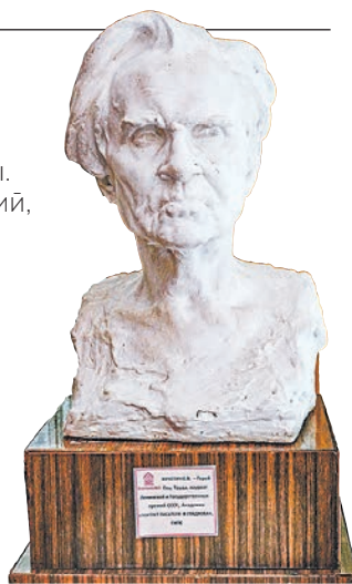
Е. В. Вучетич, «Портрет писателя Ф. Гладкова»

Несколько лет назад сотрудники Центральной библиотечной системы «Новомосковская» разработали проект под названием блог-тур. На этот раз блогеры, журналисты и историки отправились знакомиться с сокровищами Вороновской картинной галереи, которая за 50 лет существования получила славу «малой Третьяковки».