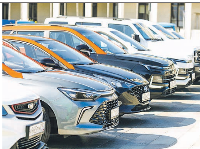
В день автомобили каршеринга совершают свыше 150 тысяч поездок

мобиля. Чтобы сделать этот сервис ещё безопаснее, с 1 сентября вводим верификацию пользователей через Mos ID. Она уже действует для курьеров и пользователей аренды электросамокатов и показала высокую эффективность – аварийность с начала этого сезона снизилась на 60 процентов», – написал Мэр Москвы в своём телеграм-канале.