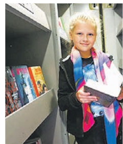
Внутри салона авто спрятались книжные полки