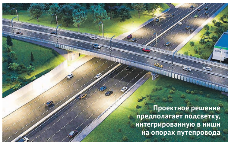
Проектное решение предполагает подсветку, интегрированную в ниши на опорах путепровода

Уточняется, что особое внимание архитекторы уделят освещению путепровода. Проектное решение пред-