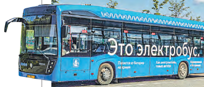
Замена одного автобуса на электробус позволяет уменьшить выбросы углекислого газа на более чем 60 тонн в год