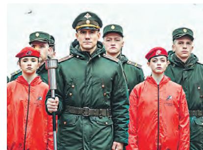
Память погибших бойцов почтили минутой молчания

« Поисковики нашли останки 26 советских солдат. Участники поисковых отрядов также работали в военных архивах, разыскивали родственников погибших красноармейцев. Имена трёх бойцов удалось установить