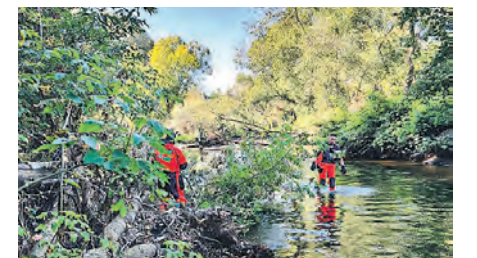
Специалисты расчистили русла рек от деревьев и мусора

В качестве профилактики возгораний в пожароопасный зимний период на открытых природных пространствах, прилегающих к населённым пунктам Лето-во, Макарово, Городище, Лаптево и Милорадово, прошла опашка лесополосы. Общая протяжённость минерализованных полос составила 11 километров, ширина – 40 метров. Этого достаточно для предотвращения распространения огня к жилым строениям. Территории очистили от растительности, сухих остатков травы и кустарников. Обращаем внимание жителей, что при подготовке дачных и частных владений к зимнему периоду также необходимо убедиться в исправности проводки и печного отопления, убрать с участков ветки, листву и другие горючие материалы.