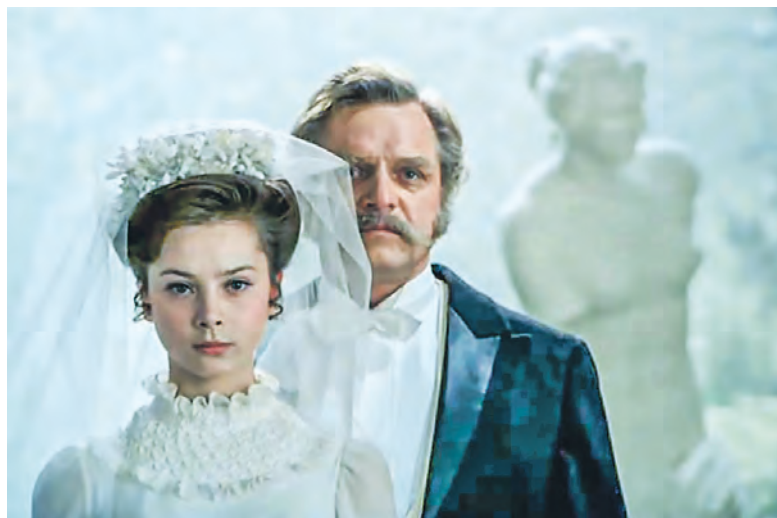
Специально для съёмок фильма в Валуево привезли гипсовые копии античных статуй