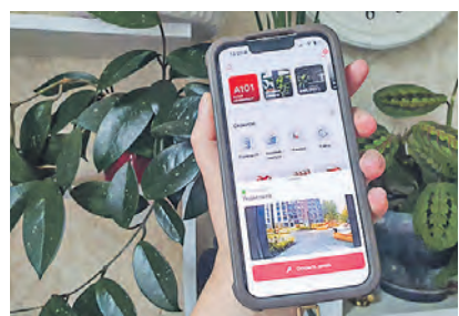
Вызов с домофона приходит на смартфон жителей в виде push-уведомления