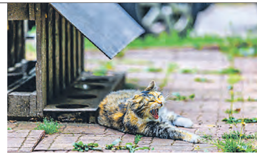
По территории санатория гуляет много пушистых «постояльцев»

Евгений Дога родился в 1937 году под городком Рыбницею в Молдавии. Отец с войны не вернулся. Мальчик рос в послевоенной разрухе, заглядываясь на сельский духовой оркестр. Подражая музыкантам, своими ру-