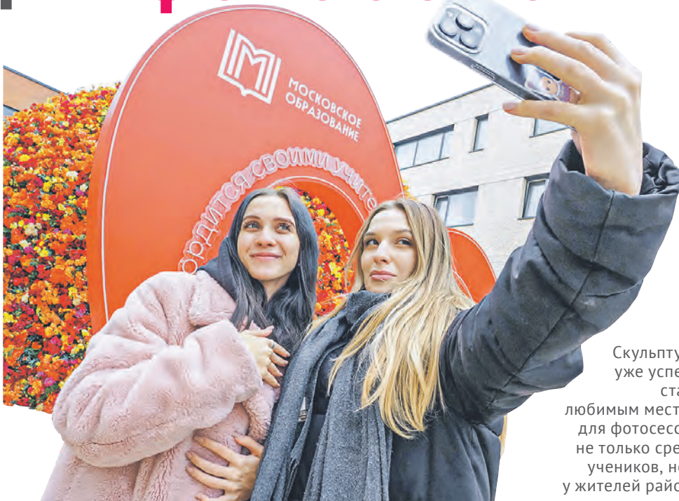
Скульптура уже успела стать любимым местом для фотосессий не только среди учеников, но и у жителей района