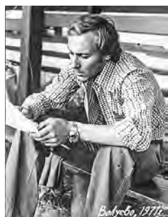
В архиве Алексея Захаринского хранится уникальный снимок Олега Янковского

«Я уже был готов получить чем-нибудь по голове, как вдруг заметил и поднял с пола несколько обрывков нотной бумаги. Сыграл одно, второе, третье. Услышав последнее, Лотяну не отстал от меня, пока я не симпровизировал до конца сцену свадьбы Оленьки Скворцовой. Ему тема понравилась»