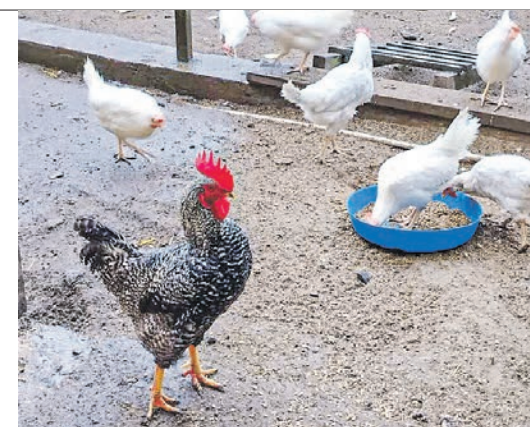
Теперь у Гастона новый дом и симпатичные соседки-«блондинки»