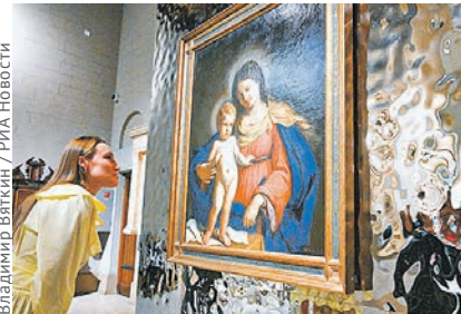
Владимир Вяткин / РИА Новости

Москвичей и гостей столицы приглашают бесплатно посетить музеи, выставочные залы и художественные галереи. Электронные входные билеты приобретаются на официальных сайтах музеев. Их нужно распечатать или сохранить на смартфонах. В самые популярные, а также небольшие музеи желательно приобретать билеты заранее.