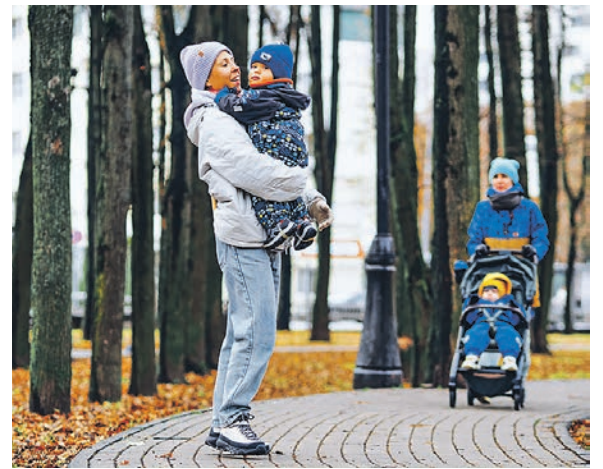
Как и в прежние времена, по липовым аллеям обожают гулять дети и их родители

– В общественной уборной провод оборвался, меня током ударило. Немец привёл меня в чувства и на руках домой отнёс родителям.