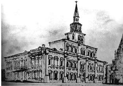
Фото организаторов мероприятия

до 29 марта 2026 года, вт.–вс. с 11:00 до 21:00