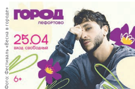
Фото: Фестиваль «Весна в городе»

Фестиваль в ТРЦ «ГОРОД Лефортово» объединит моду, красоту, музыку и весеннее настроение. На сцене выступят эксперты с лекциями о моде и стиле. В зонах красоты будут работать визажисты и дру-