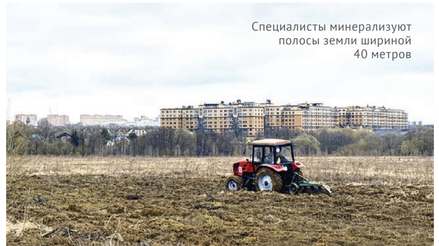
Специалисты минерализуют полосы земли шириной 40 метров

Работы проходят вблизи населённых пунктов Летово, Макарово, Городище, Лаптево и Милорадово