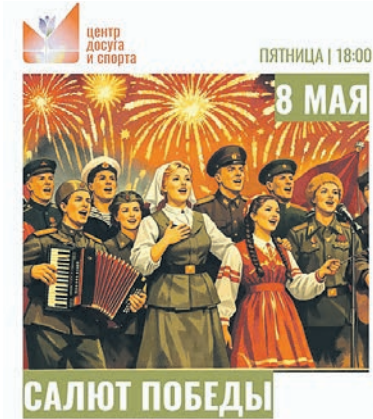
Праздничная концертная программа

На сцене возле ДК «Мосрентген» состоится праздничная концертная программа местных творческих коллективов, приуроченная ко Дню Победы. В программе – лирические