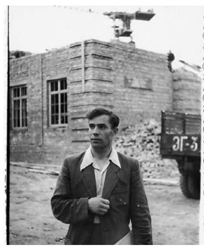
Строительство нового здания школы в 1955 году