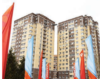
Аллея флагов в посёлке Коммунарка

улицы Героя России Соломатина, сцена в парке посёлка завода Мосрентген, а также проспект Магеллана и площадь около ДК «Коммунарка».