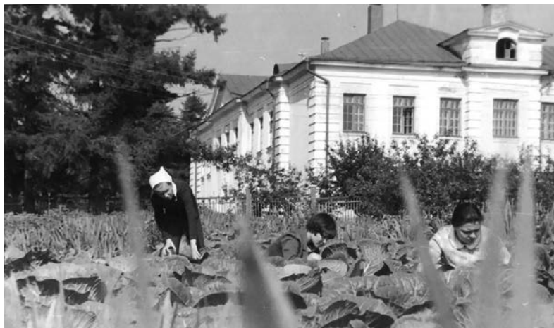
На пришкольном участке выращивали овощи

«Ученики у меня были самые лучшие! Правда, и нагрузка нешуточная. Я приду со школы, детей и мужа ужином накормлю. Они все спать, а я сижу, тетрадки проверяю»