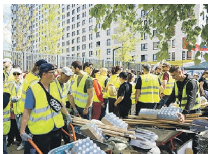
В акции приняли участие более 250 человек

Яркий солнечный день, улица Саларьевская, сотни людей с лопатами и саженцами. Ещё неделю назад участники с волнением следили за прогнозом погоды: синоптики обещали дождь. Но судьба улыбнулась, день выдался ясным и тёплым, что добавило радости долгожданному событию.