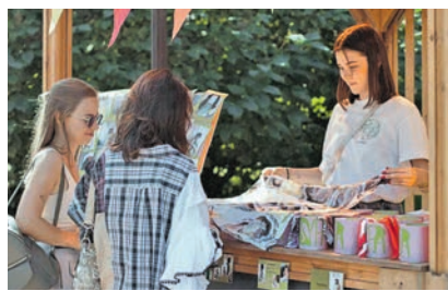
Фото: Фестиваль локальных брендов «Попкорн Маркет»

Под открытым небом на Хлебозаводе соберутся десятки локальных брендов и мастеров, которые представят свои уникальные товары. В этот раз на маркет привезут платья и кожаные корсеты с цепями, уникальные рюкзаки, ароматные свечи, крафтовые духи, линогравюры, вязаные вещи, а также принты с уличной эстетикой. Можно будет поучаствовать в мастер-классах по тафтингу (ковровой вышивке), росписи и живописи. На лужайке пройдёт занятие по йоге с розовым дресс-кодом, а диджеи приготовили сет. Первые гости получат в подарок карамельный попкорн.