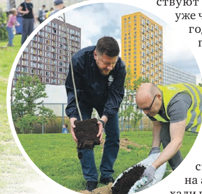
Сажать деревья жители района приходили вместе с семьями и питомцами

Подготовка к мероприятию началась за день до посадки: строители завезли грунт, инвентарь, колышки и саженцы, подготовили лунки. А уже утром 16 мая возле шатра рядом с домом №10, корпус 2 на Саларьевской улице начали собираться участники: жители жилого комплекса, семьи с детьми и собаками, студенты-волонтеры. Всего в акции приняли участие более 250 человек.